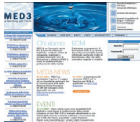
La home page del portale di e-learning Med3

In questo scenario si inserisce quindi Med3 che, grazie ai partner coinvolti nel progetto, garantisce qualità tecnico-